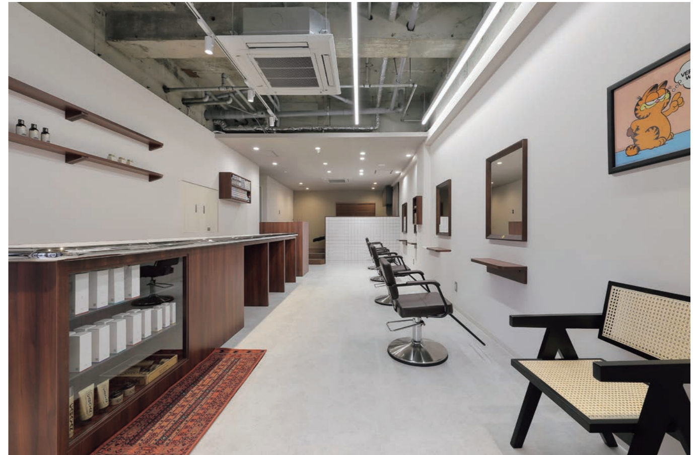
マンツーマンスタイルで施術を行っており、お客さまには心身ともにリラックスできる質の高い空間づくりを心がけた。圧迫感が出ないよう、手前の施術ブースはスケルトン天井にした

「美容室っぽくない美容室」を念頭に、インテリアショップのような空間づくりを目指した。お客さまからは「圧迫が少なく、落ち着く」「パーカOUNTERや小物類も目新しく、美容室っぽくない」「シャンプー台はリラックスできる」など、高評価を得ている。サロン名「Look at」は注目されるような髪、人になってほしいという願いを込めて命名したという