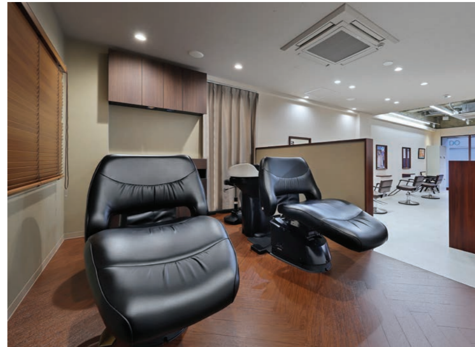
お客さまがゆったりと落ち着いて過ごせるよう、シャンプーブースはブラインドや床などを木調で統一