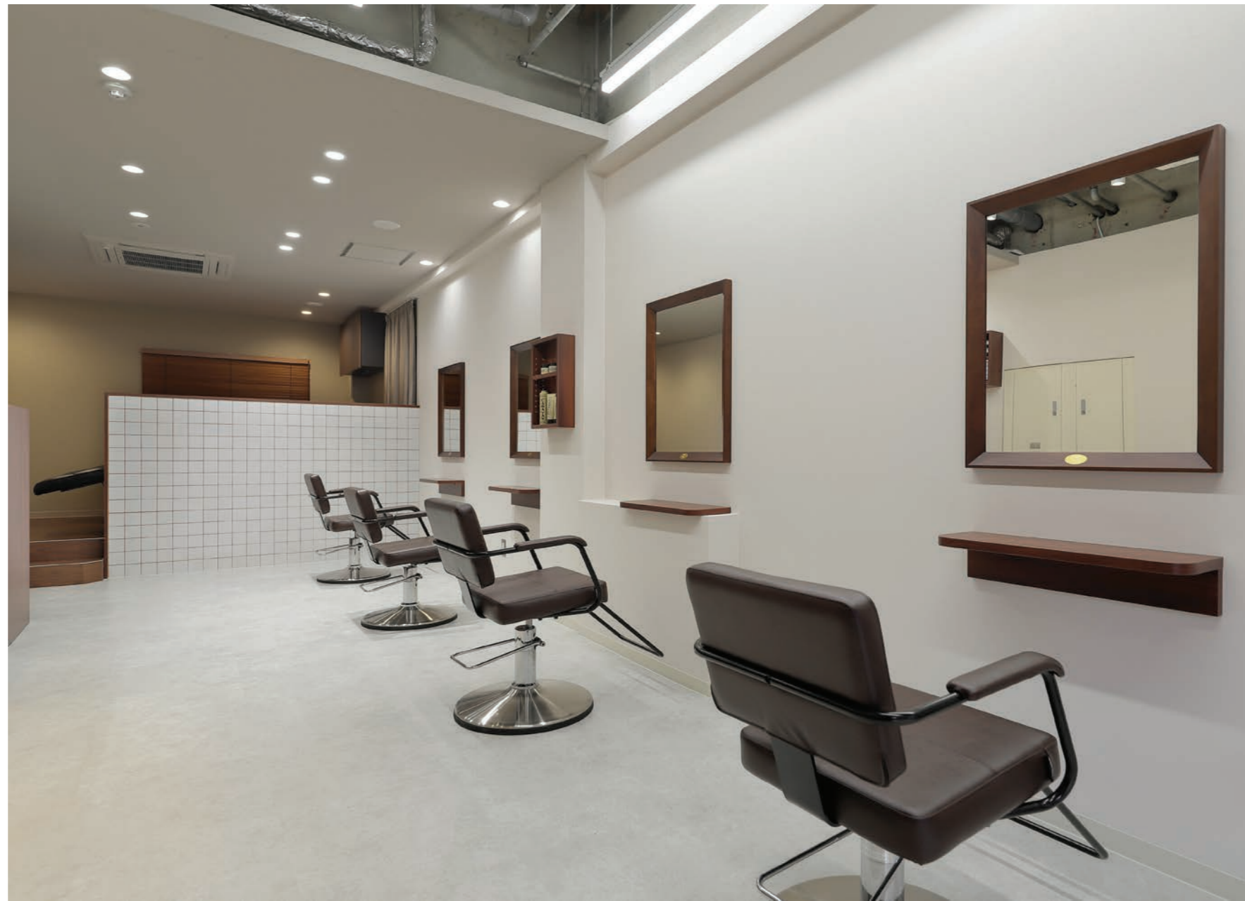
サロンの形状が細長いので、奥にシャンプーブースを設えて、奥まるにつれ壁や照明などの色合いを濃くした。施術ブースのライトは、白色系。仕事がしやすく、撮影する場合なども色が見やすい