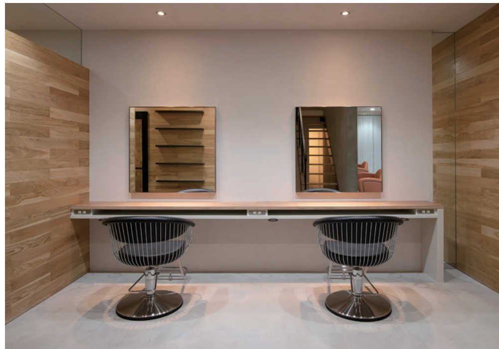
ペアや親子連れのお客さま向けの施術ブース