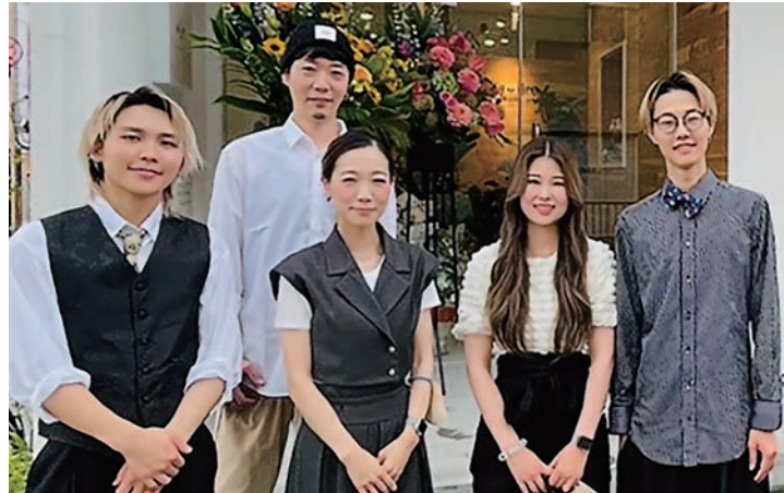
中西代表（後列）とスタッフの皆さん