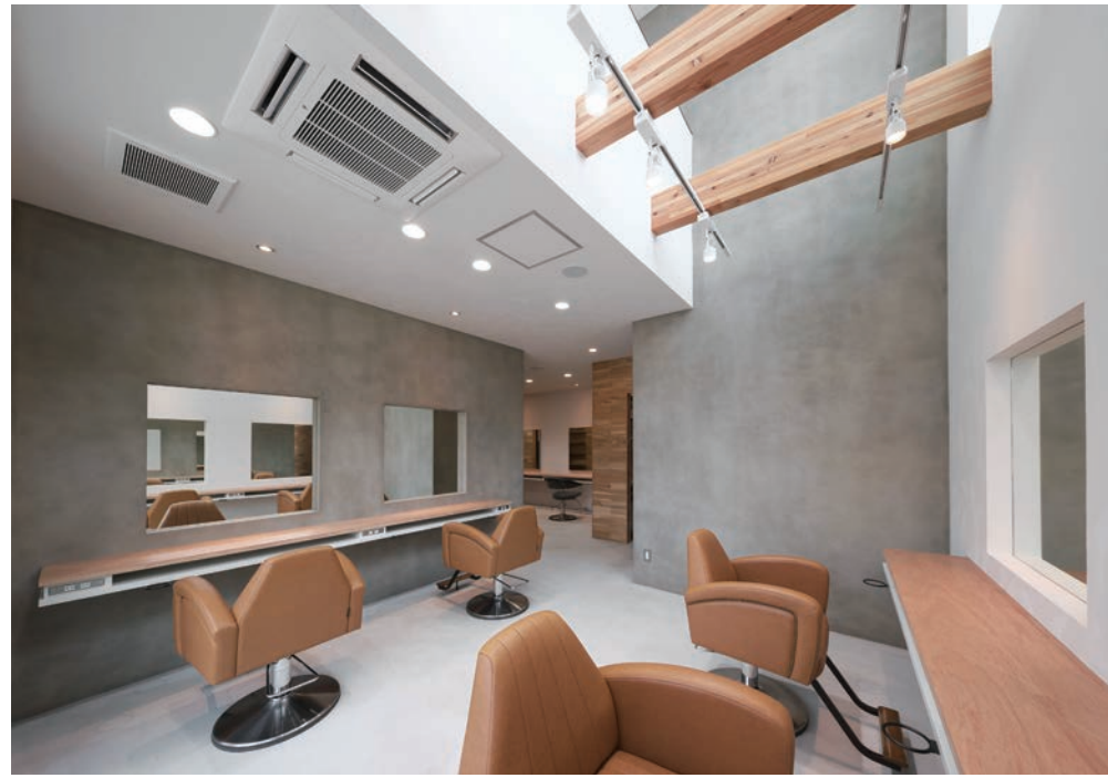
天井部分が吹き抜けになっており、自然光をたっぷり、とり入れた施術ブース。明るくて広々している。ヘアカラーで、自然光と室内との見え方の違いなどを具体的に説明できる。四角い鏡は壁に埋め込んで奥行きをもたせ、室内を広く見せる演出の一翼を担っている